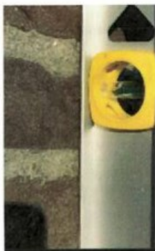
Gemeten vanaf de bovenkant van de tuinmuur