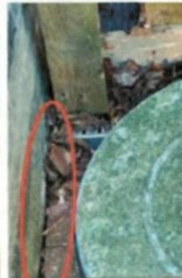
onderkant tuinmuur en tegels tuin