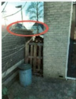
Tuinmuur en muur huis