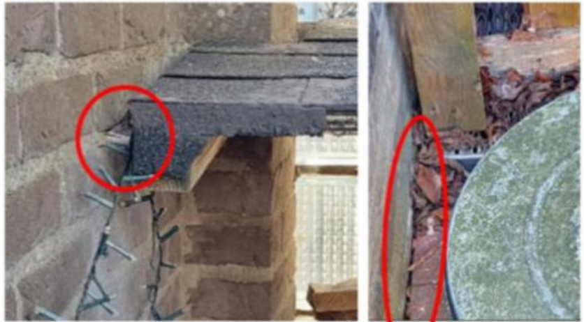
onderkant tuinmuur en tegels tuin