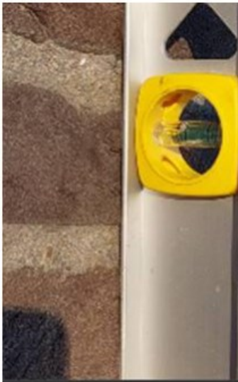
Gemeten vanaf de bovenkant van de tuinmuur