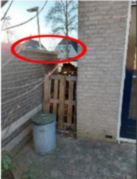
Tuinmuur en muur huis