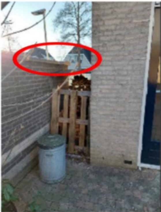
Tuinmuur en muur huis

Geven aan dat de muur niet meer waterpas staat; onderin staat de muur waterpas en bij de tegels (3 e foto) zie je geen ruimte tussen de muur en de tegels. Daarna loopt de muur steeds minder waterpas, dus licht hellend. Volgens is er tussen het dakje van de houtopslag tussen deze tuinmuur en de muur van hun huis meer ruimte zit.