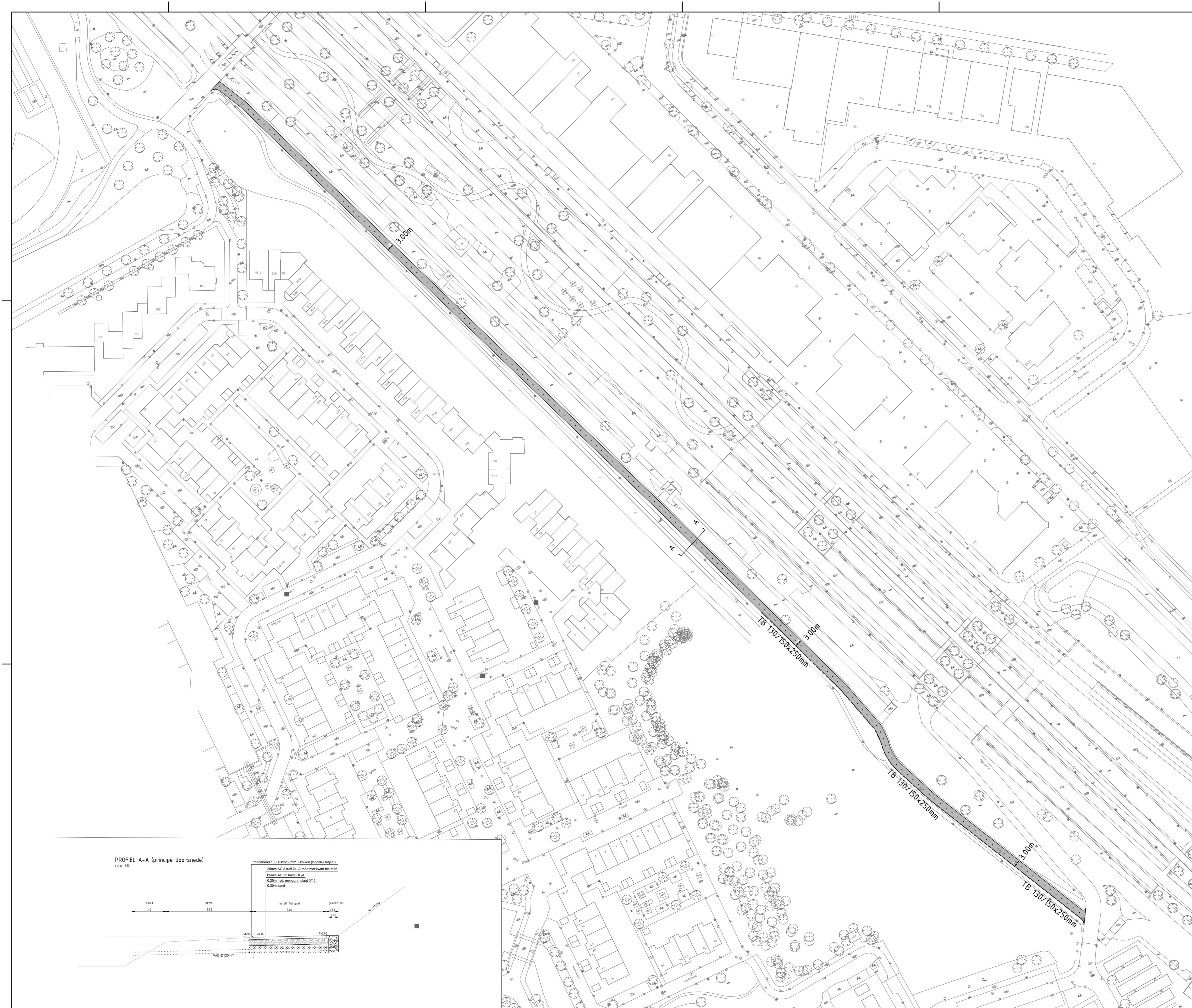
PROFIEL A-A (principe doorsnede)